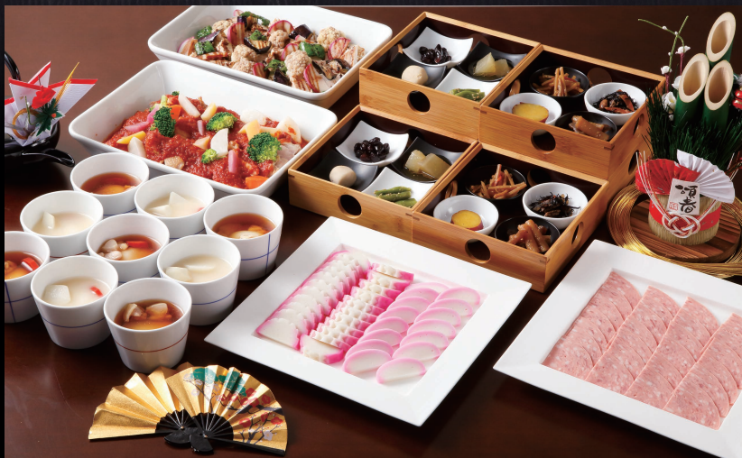
※写真(画像)はイメージです。

※仕入れ状況等により内容を変更させていただく場合がございます。 ※表示価格は全て税込価格です。