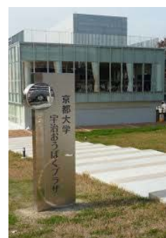
JR奈良線「黄檗」駅より徒歩約3分 京阪宇治線「黄檗」駅より徒歩約3分